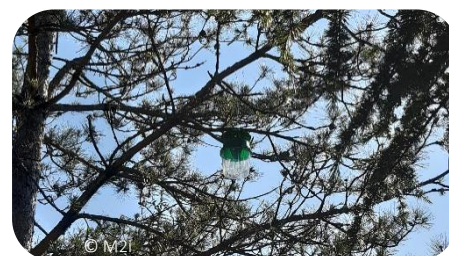
Exemple de pièges sur pin à appliquer sur chêne